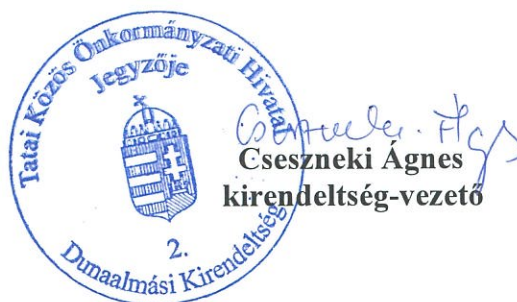
Cseszneki Ágnes kirendeltség-vezető