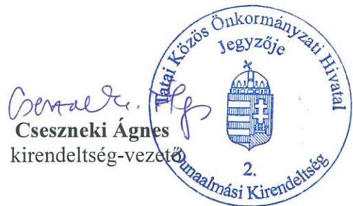
Cseszneki Ágnes kirendeltség-vezető